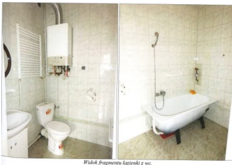
Widok fragmentu łazienki z wc.