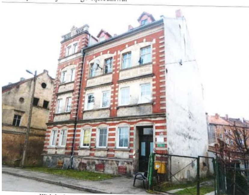
Widok elewacji frontowej – Lubań, ul. Robotnicza nr 22A.

na sprzedaż lokalu mieszkalnego Nr 8 znajdującego się w budynku położonym w Lubaniu przy ul. Robotniczej 22a wraz z udziałem we współwłasności nieruchomości gruntowej (działka nr 32/2, AM 10, Obręb III o powierzchni 169 m 2 , JG1L/00022175/7)